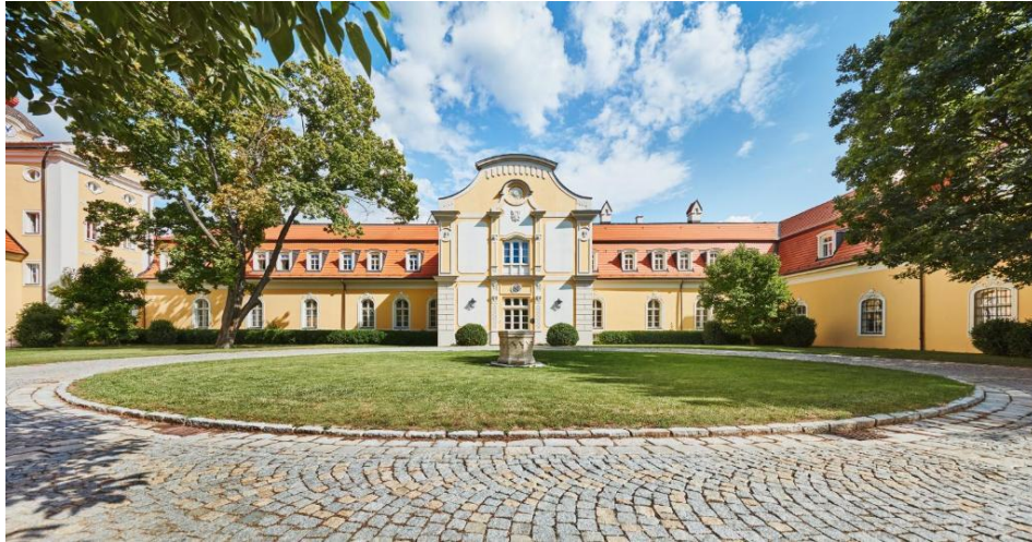
Hotel****Château Bela, Belá 1, 94353 Belá, Slowakei (Budapest/Ungarn-67km, Donau/Grenze-5km Štúrovo-11km)